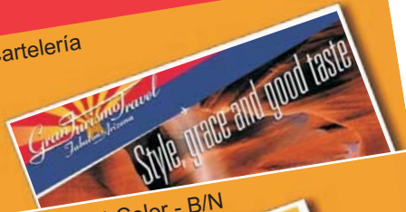
Cartas A4 Color - B/N